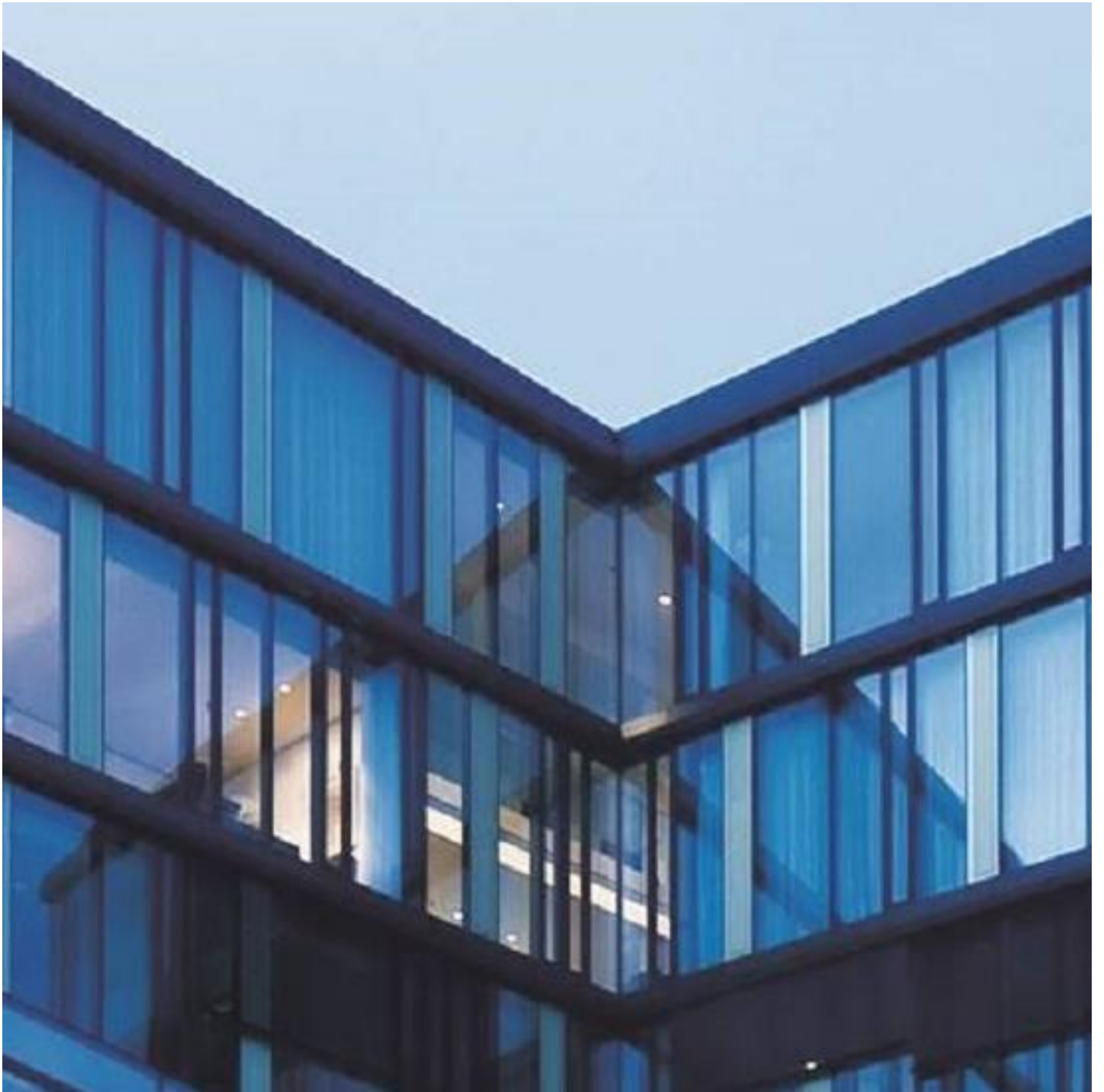
SGG COOL-LITE ST