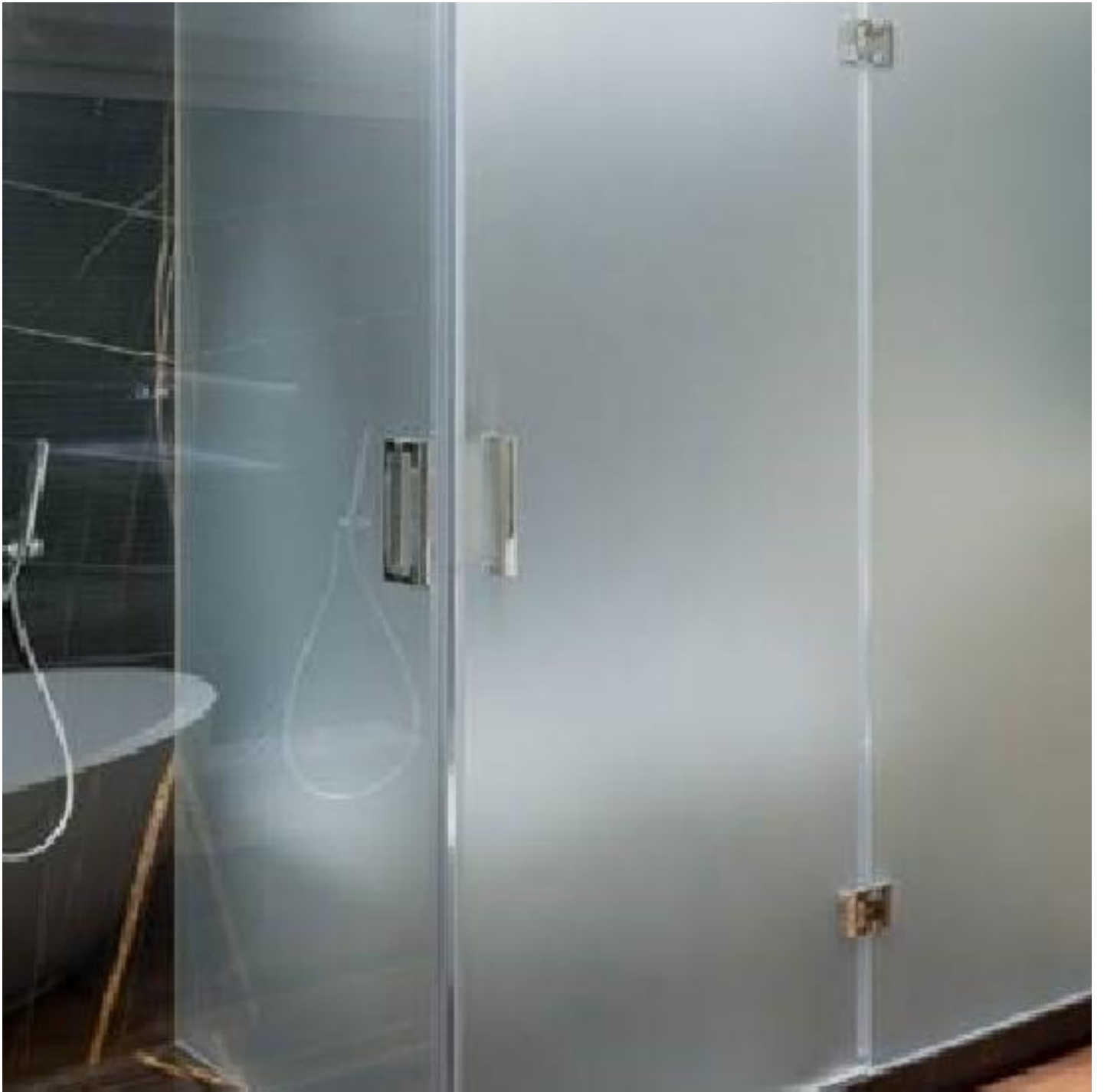
SGG SATINOVO 1C