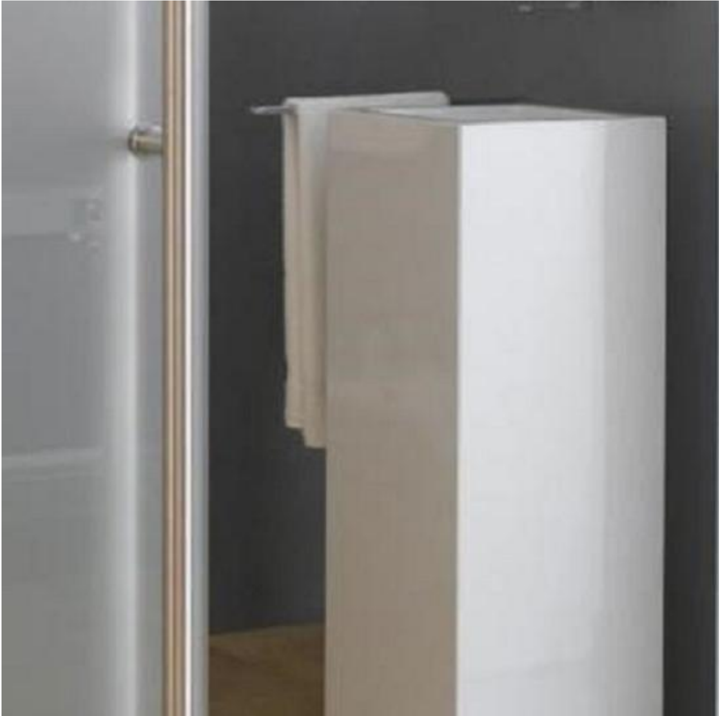
SGG SATINOVO DUO